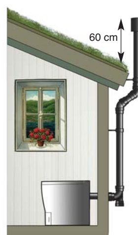
Ventilasjonsrøret føres ut gjennom vegg. Maks 2 x 45° bend og 1 x 90° bend.