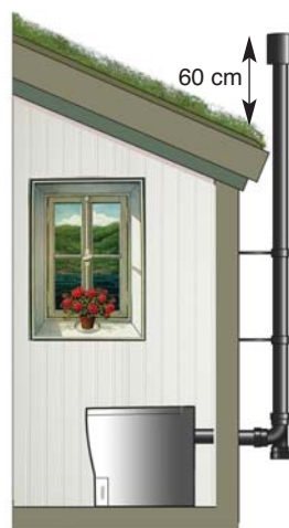
Ventilasjonsrøret føres ut gjennom vegg og opp over taket.

Det må være en jordet stikkontakt i forbindelse med toalettet, normalt trenger du ikke å endre eksisterende installasjon, da toalettet kun bruker et gjennomsnitt under forbrenning på 850W/time.