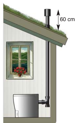
Ventilasjonsrøret føres rett opp og over taket.